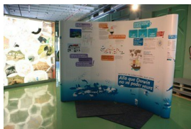
La exposició en la Fabrica del Sol