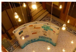
La exposició en el Centro Cívico Can Deu