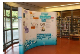
La exposició en la Biblioteca Xavier Benguerel