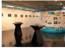
La exposició en la Biblioteca Sagrada Família