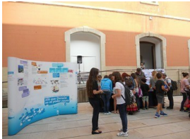
La exposició en la Noche de los investigadores 2014