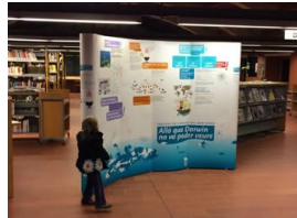
La exposició en la Biblioteca de Viladecaballs

Aquest projecte ha sigut possible gràcies a la financiació rebuda per el Departament d'Innovació, Universitats i Empresa de la Generalita de Catalunya.(Referència:ACDC-00073).