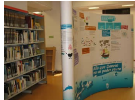
La exposició en la Biblioteca de Moià