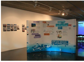
La exposició en la Biblioteca Sagrada Família